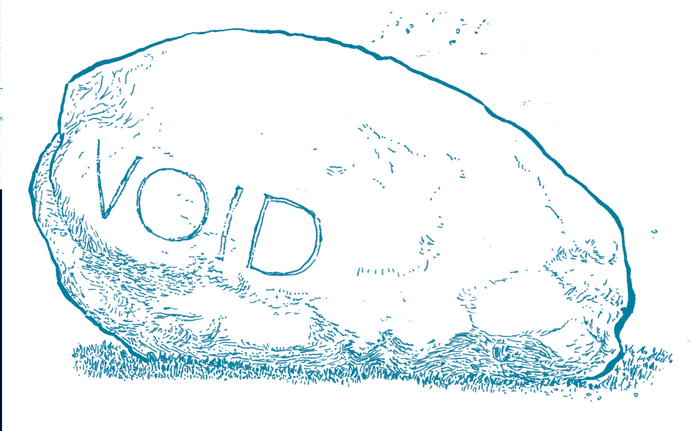
Le rocher de George — Arp-Museum, Rolandseck

LÉGENDE DE LA GENÈSE DU TAO TE KING ECRIT PAR LAO TSEU SUR LE CHEMIN DE L'EXIL [...] Le quatrième jour à travers pics et bosses, au milieu du chemin surgit un douanier. « Rien à déclarer ? » — « Rien. » Et le gosse qui consultait le bœuf dit : — « Il a enragé. » Et c'est ainsi que tout fut expliqué. [...] Le douanier ajouta — « Qu'en a-t-il retiré ? ». Le gosse dit : — « Que l'eau qui effleure la pierre énorme avec le temps en vient à bout. » [...] — « Qu'est-ce tu veux dire avec ton eau, vieil homme ? » Le Vieillard s'arrêta : — « ça t'intéresse, ami ? » — « Je ne suis qu'un agent des douanes, mais savoir qui l'emporte et qui pas, moi aussi, ça m'intéresse. [...] Alors si tu saisis, dis ! Ecris ! dicte à ce gosse ! Une chose pareille, on ne la garde pas pour soi » [...] De son bœuf descendit le sage. Ils écrivirent, le gosse et lui, pendant sept jours. Le douanier leur apportait la soupe (et n'osait plus maudire les contrebandiers) [...] Quatre-vingt-une étaient les maximes du sage. Le gosse au douanier un matin les remit. Ils reprirent la sente avec un grand merci. [...] Mais ne célébrons pas uniquement le sage. Dont le nom au milieu du livre resplendit ! La sagesse du sage est fruit d'un arrachage. Au gardien des frontières aussi disons donc un merci : l'homme qui la lui arracha, c'est lui. Bertolt Brecht